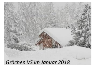
Grächen VS im Januar 2018

Wir wünschen Ihnen eine schöne Adventszeit und viel Freude und erholsame Stunden über die Festtage. Im neuen Jahr wünschen wir Ihnen einen guten Start und viel Glück und Erfolg bei all Ihren Projekten und Plänen.